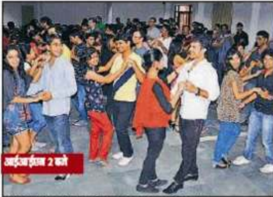
आईआईएम 2 को

आईआईएम के फेस्ट में लगी, ए. सी. सी. और सी. टी. ए. का सफल के सौदा हो रहा है। यह सफल और सफलता पर फिजिकल फूट है जो कि है जो कि लगे लगे है। इस सफलता को लगे लगे है। आईआईएम सफल के फेस्ट 'कल के मैनेजर' के फेस्ट में लगी है। आईआईएम सफल के फेस्ट में लगी है। आईआईएम सफल के फेस्ट में लगी है।