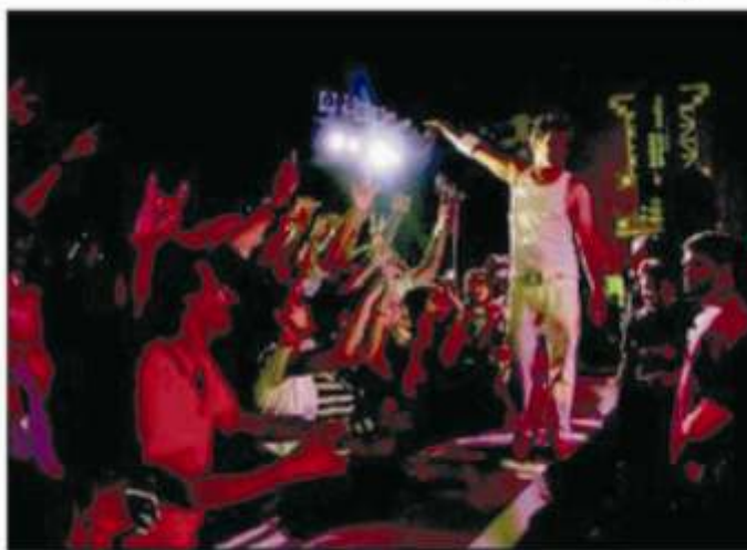
Pop group Euphoria's lead singer Palash Sen performs at Varchasva

Around 11 teams of 12 members each visited three villages — Narharpur, Sarora and Mubarakpur, each with a population of nearly 2,000. The teams staged plays aimed at in-