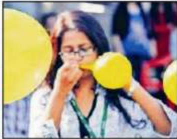
धूम धूम से ही फेस्टिवल।