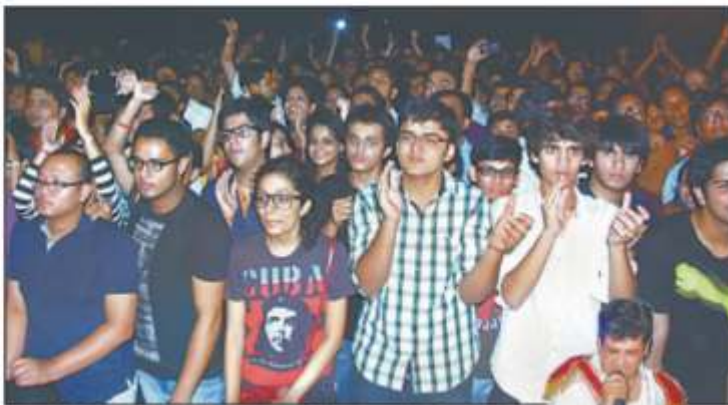
लखनऊ के सेंट्रल क्वार्टर 'वर्षस्व 2013' में आयोजित की गई प्रतियोगिताओं में भागीदारी के लिए हुए थे।

लखनऊ। भावी पंजा लड़ाओ समेत अन्य कई प्रतियोगिताओं में भागीदारी के लिए हुए थे। भावी पंजा लड़ाओ समेत अन्य कई प्रतियोगिताओं में भागीदारी के लिए हुए थे। भावी पंजा लड़ाओ समेत अन्य कई प्रतियोगिताओं में भागीदारी के लिए हुए थे।