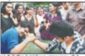
लखनऊ के सेंट्रल क्वार्टर में आयोजित की गई प्रतियोगिताओं में भागीदारी की।