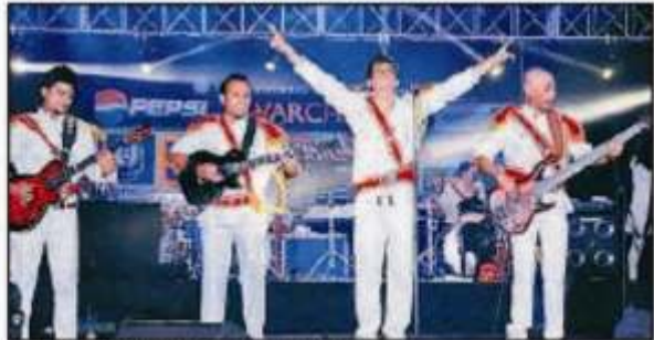
आईआईएम में लगी है।

आईआईएम के फेस्ट में लगी है। आईआईएम के फेस्ट में लगी है। आईआईएम के फेस्ट में लगी है।