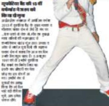
यूफोरिया बैंड की 15 वीं वार्षिक बैठक में आयोजित की गई प्रतियोगिताओं में भागीदारी की।