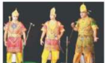
अभिनव इन्स्टीट्यूट के छात्रों ने पंजा लड़ाओ की प्रतियोगिता में भागीदारी की।