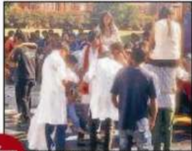
आईआईएम में लगी है।

आईआईएम के फेस्ट में लगी है। आईआईएम के फेस्ट में लगी है। आईआईएम के फेस्ट में लगी है। आईआईएम के फेस्ट में लगी है।