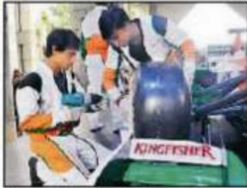
कल के मैनेजर के फेस्ट में लगी है।

आईआईएम सफल में लगी है। आईआईएम सफल में लगी है। आईआईएम सफल में लगी है। आईआईएम सफल में लगी है। आईआईएम सफल में लगी है।