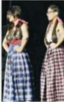
सभी नेजसवार की नर्तने और दिखने के दौरान

➤ IIM के सोर्ट्स और कल्चरल फेस्ट वर्चस्व-21 का शुभारंभ