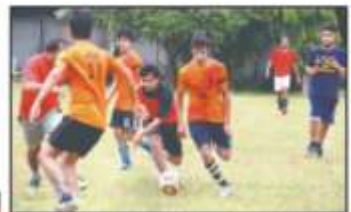
कुतुबुल मुबारक में एक टूर्नामेंट में भागीदारी की।