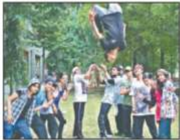
एक्टिंग के छात्रों ने 'वर्षस्व 2013' में भागीदारी की।