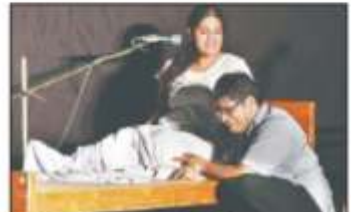
मुंबई के नवाबे ट्यूबि एक्टिंग के स्टूडेंट ने 'वर्षस्व 2013' में भागीदारी की।