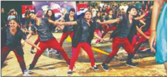
आईआईएम में वर्चस्व 2013 के अंतिम दिन रिविजर को छात्रों ने स्ट्रीट डांस में एक से बढ़कर एक स्टोम दिखाए।

2013 के अंतिम भावी प्रबंधकों ने जहां एक ओर खेती को अपनी प्रशस्ति से इलाक में वहीं दूसरी ओर विभिन्न प्रतियोगिताओं में भी जीत के लिए वर्चस्व को अग्रणी बना ली। सन बर्न कार्यक्रम के सहायक केनान से अर्द्धविक्रम हुआ। इसमें वेस्टर्न ड्रेस के अलावा ट्रेडिशनल ड्रेसिंग ड्रेस में भी स्टूडेंट ने रैप पर कैटाचिंग किया। इसमें विदेशी से पहले अरु स्टूडेंट्स जब इतिहास ड्रेस खनकर कैटाचिंग करने खुले तो दर्शकों ने जोरदार तालियों से उनका इलाकबाल किया। दोर एत सन बर्न कैटाचिंग के सन वर्चस्व का समापन हो गया। वर्चस्व लखनऊ की प्रतियोगिता 'विचित्र' में भी दिलचस्प मुकदमाला देखने को मिला। इसमें अरुप चाली डिजे करीब की टीम विजेता घोषित की गई, दूसरे नंबर पर आईटी करीब की टीम रही। वहीं हुए डांस कॉम्पटीशन में करीब और चोकेशनल स्टूडी, नई दिल्ली की टीम विजेता रही और आईआईएम लखनऊ की टीम दूसरे नंबर पर रही। सोलैर डांस कॉम्पटीशन 'विन्ना' में करीब और चोकेशनल स्टूडी नई दिल्ली की टीम प्रथम स्थान और आईटी करीब