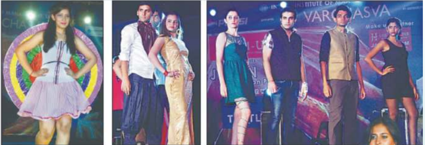
आईआईएम में तीन दिन से चल रहे वर्ल्ड का रिविजर को समापन हो गया। इस दौरान भावी प्रबंधकों ने म्यूजिक, डांस, ड्रामा व स्पॉट्स की विभिन्न प्रतियोगिताओं में अपना वरमखम दिखाया। अंतिम दिन सन बर्न को हुए फैशन परेड में भी छात्रों ने रैप पर अपने-अपने कदमों से कैटाचिंग कर दावाओं को खपत कर दिया।

Name of the Publication : Amar Ujala Edition : Lucknow Date : 7/10/13